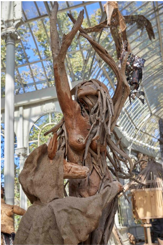
Kidlat Tahimik. Magallanes, Marilyn, Mickey y fray Dámaso. 500 años de conquistadores RockStar Detalle de la exposición Palacio de Cristal. Octubre, 2021

El segundo conjunto escultórico, situado al fondo del palacio, hace alusión al contexto concreto de la Exposición General de las Islas Filipinas de 1887, para la que fue construido el Palacio de Cristal. La iniciativa, liderada por el Ministerio de Ultramar, tenía por objeto exhibir la vida y cultura del archipiélago filipino, dependiente de España en aquel momento. En el marco del evento, donde se mostraban la flora, fauna y poblaciones del archipiélago, se programaron una serie de actuaciones de los indígenas Igorrotes, grupo étnico al que pertenece Tahimik, exhibidos como una especie exótica. Este hecho fue denunciado y calificado como “zoo humano” por José Rizal , el precursor de la Independencia filipina, que se encontraba entonces en Madrid. Dentro de la instalación, Tahimik presenta a Rizal como el joven estudiante de medicina que era entonces, tomando nota en su cuaderno del abusivo trato que sus compatriotas estaban recibiendo. Sin embargo, al contrario que las tradicionales representaciones del héroe nacional, Tahimik decide vestirlo con un taparrabos, simbolizando así su unión con su cultura de origen.