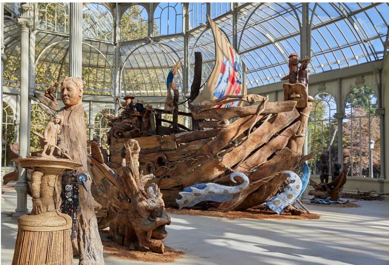
Kidlat Tahimik. Magallanes, Marilyn, Mickey y fray Dámaso. 500 años de conquistadores RockStar Palacio de Cristal. Octubre, 2021

FECHAS: 28 de octubre de 2021 - 6 de marzo de 2022