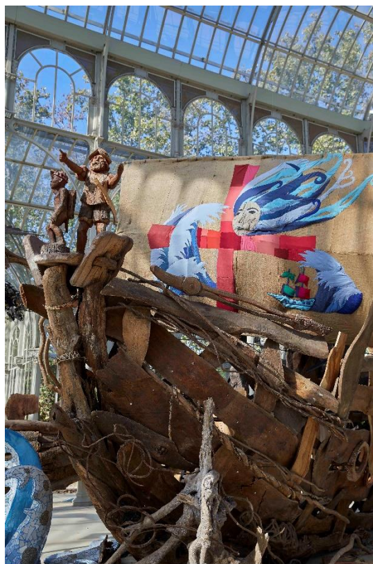
Kidlat Tahimik. Magallanes, Marilyn, Mickey y fray Dámaso. 500 años de conquistadores RockStar Detalle de la exposición Palacio de Cristal. Octubre, 2021

Tahimik reivindica, además, el papel en la expedición del esclavo Ikeng , también llamado Enrique de Malaca , representado aquí junto a una segunda personificación de Magallanes sobre la proa de un enorme galeón de madera casi de tamaño natural. Según las interpretaciones de algunas fuentes literarias, Enrique de Malaca (nacido en Indonesia, Malasia o Filipinas, ca. 1495) se habría apoyado en los saberes tradicionales basados en la astrología y en su conocimiento de la naturaleza para indicar a Magallanes el camino que les conduciría al mar del Pacífico a través del Estrecho conocido posteriormente con el nombre del navegante portugués. Esta circunstancia, ignorada por la historia oficial, no se corresponde con la versión de Antonio Pigafetta (1480-1534), cronista de la expedición, quien apenas dejó constancia del protagonismo de Malaca. Esta historia ya fue tratada por Tahimik en su película Balikbayan#1 Memories of Overdevelopment Redux (1979-1917) dando cuenta de las constantes temáticas que vertebran el trabajo del artista y la consiguiente permeabilidad entre la pantalla y sus instalaciones.