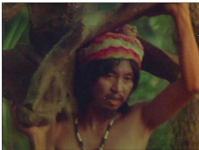
Kidlat Tahimik. Balikbayan #1. Memorias del superdesarrollo redux IV . Película, 2021.

El miércoles 3 de noviembre a las 18:30 horas se proyectará en el Palacio de Cristal del Parque del Retiro la última película de Kidlat Tahimik, Balikbayan #1. Memorias del superdesarrollo redux IV (2021), un nuevo montaje de un proyecto que ha durado más de 30 años, sobre la circunnavegación de la tierra y los relatos de “descubrimiento” occidental del Nuevo Mundo.